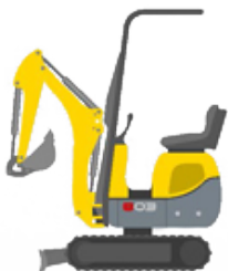
Kompakt gravemaskin 803